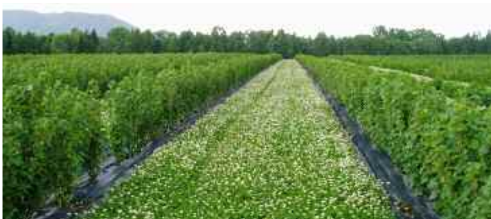
Blommor i gångarna kan konkurrera med grödan.

Klipp gräsgångarna mellan raderna inför blomningen så att inte maskrosor, tusenskönor, vitklöver o. dyl. konkurrerar med grödan om pollinatörerna. Klipp gräset så tidigt på morgonen att pollinatörerna ännu inte hunnit flyga ut.